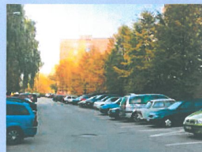
Problém? Třeba parkování.