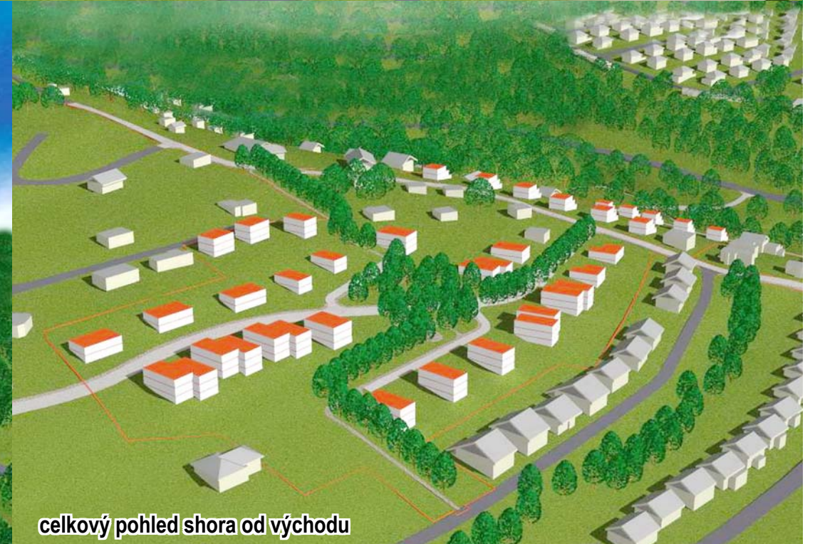
celkový pohled shora od východu