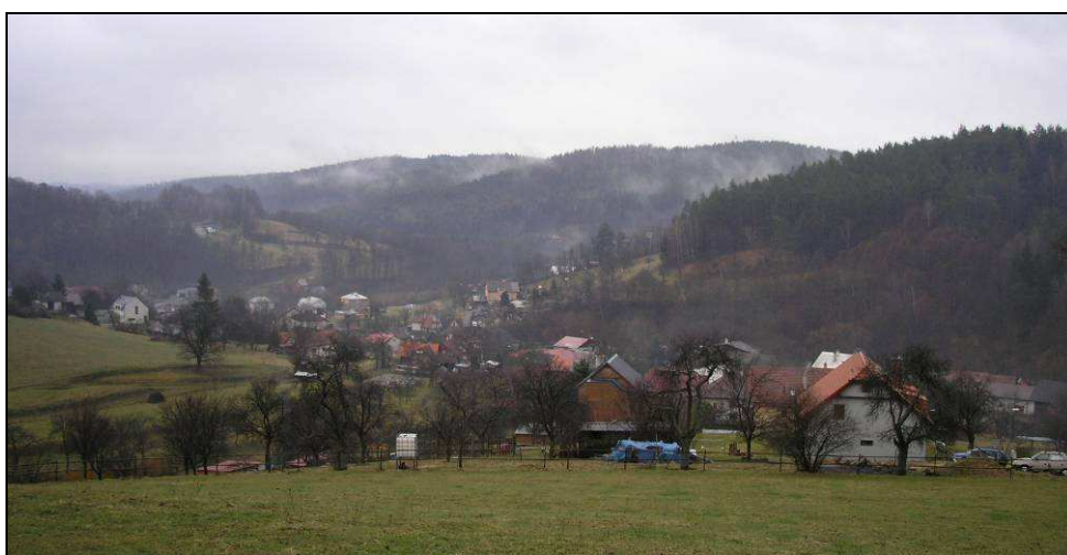
Pohled na jihozápadní část obce od S z protilehlého svahu, kde zástavba nevhodně postupuje stále do vyšších poloh