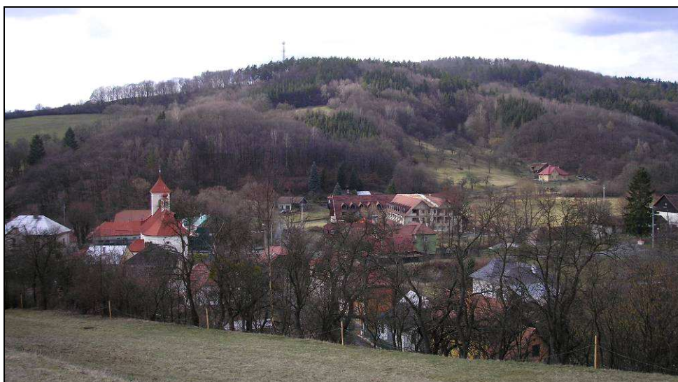
Střední část obce od V s charakteristickou dominantou kostela sv. Kateřiny a nedostavěným objektem rušivého měřítka i ztvárnění v lokalitě přijatelné k rozvoji zástavby