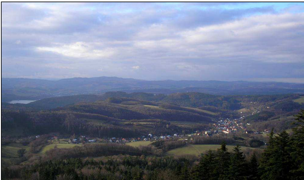
Pohled od S ze Sýkornice - Vrzávkých skal - charakteristická liniiová struktura vsi v údolí obklopená svahy