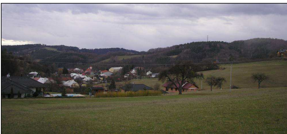
Pohled od SV v ose údolí Černého potoka, v popředí rušivá, novodobá zástavba městského typu obsazující úpatí svahů