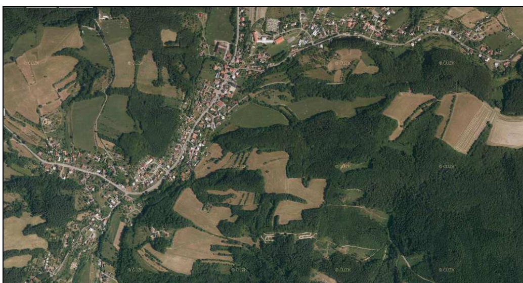
Historický (1950) a současný letecký snímek