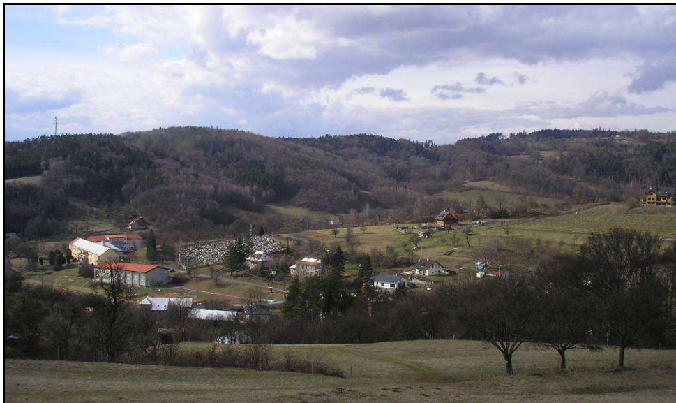
Pohled od J na zcela nevhodnou urbanizaci svahů nad hřbitovem ve střední části obce