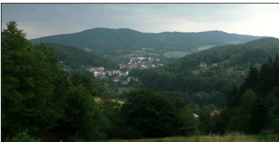
Pohled od JZ v ose údolí Dřevnice na jádro vsi pod lesnatým hřbetem Sýkornice - Koptná