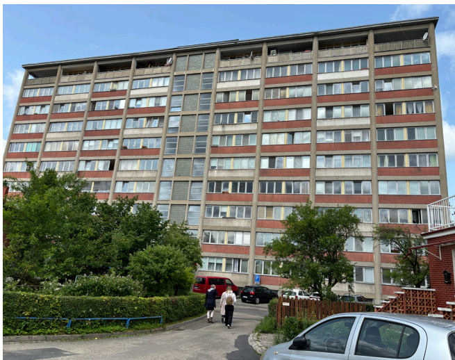
Obrázek 11 Experimentální bytový dům Drofa, zdroj: ONplan, 2025

Experimentální chodbový dům hotelového typu (Drofa) stojí na okraji obytné čtvrti Zálešná a pochází z 1. poloviny 60. let (Obrázek 11). Tento dům hotelového typu se zaměřuje na dočasné bydlení jednočlenných a dvoučlenných domácností. Je zde 173 bytových jednotek, které jsou jednopokojové a mají drobný kuchyňský kout v předsíni a koupelnu s vanou a toaletou. Součástí je i 26 garsoniér, které jsou poloviční velikosti oproti základnímu modulu (6 x 6 m). Dům je od roku 2000 kulturní památkou, je ve vlastnictví města. Část bytů je tak dochována poměrně autenticky. Stavbou, vybudovanou podle konceptu kolektivního bydlení, je také Kolektivní dům od architekta Jiřího Voženilka. V tomto objektu sídlí platforma Kolektiv.Haus, jako součást příspěvkové organizace Živý Zlín. (Blíže popsáno v kapitole o aktérech (Drofův dům (NPÚ), nedatováno), (Experimentální dům Drofa, nedatováno).