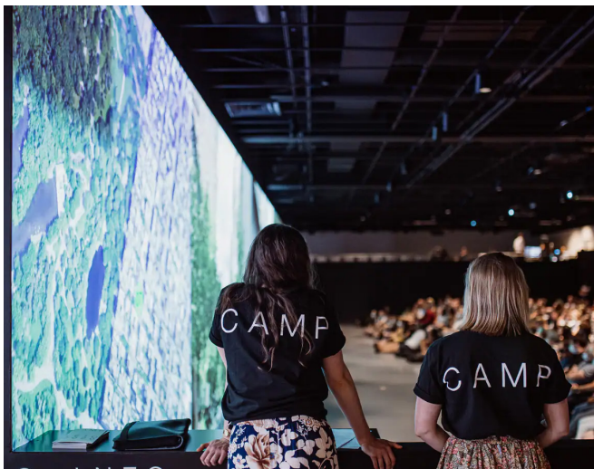
Obrázek 19 Hlavní sál CAMP Praha, zdroj: (CAMP - navštivte nás, nedatováno)