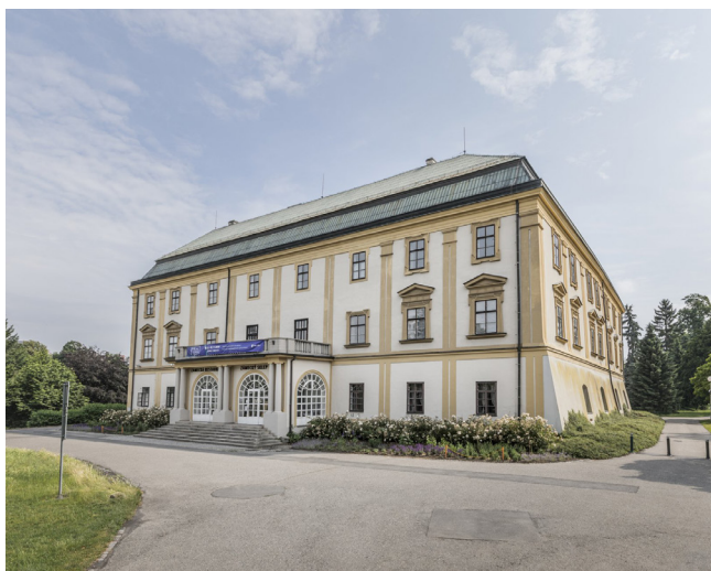
Obrázek 1 Zámek Zlín I

Na místě zámku (Obrázek 1) stávala původně gotická tvrz, o které existují záznamy již z konce 15. století. V průběhu staletí procházelo toto sídlo různými změnami, významnou z nich byla stavba nového křídla nad zbořeným severním traktem, probíhající od 70. let 18. století. Z této doby pochází současná klasicistní (částečně barokní) podoba zámku. Na začátku 20. století proběhly ještě úpravy pod taktovkou Leopolda Bauera a v roce 1935 proběhly baťovské úpravy. Zámek v roce 1929 koupilo město Zlín a byl otevřen veřejnosti. V zámku je v současnosti Galerie Václava Chada, kulturní a kreativní centrum Živý Zlín a prostory pro akce a výstavy (Zámek, nedatováno).