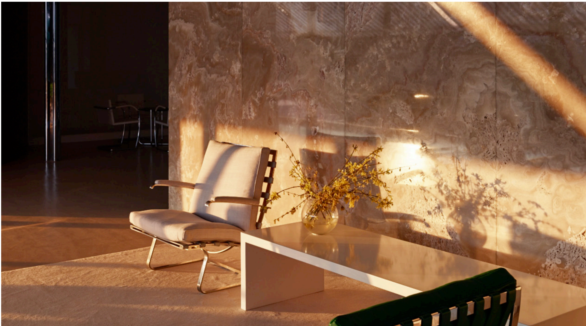
Obrázek 29 Onyxová stěna Vila Tugendhat