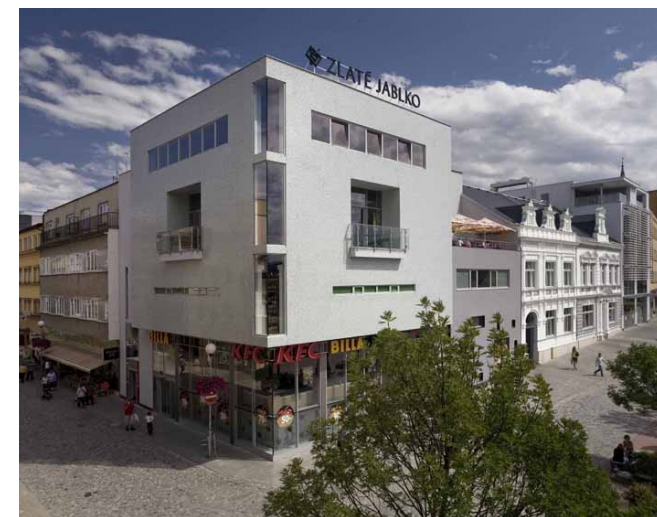
Obrázek 14 Obchodní dům Zlaté jablko, zdroj: (Sládeček, nedatováno)

Zlaté jablko (Obrázek 14) je obchodní komplex z let 2007 až 2008, který představuje největší novodobý zásah do centra Zlína. Součástí je fasáda záložny, která byla popsána v kapitole 1.1 (fasáda směrem na náměstí Míru). Pohledu z ulice Dlouhá dominuje průčelí s filmovým pásem, kde jsou zřetelné kinosály v horních podlažích. Současně jde o odkaz na zlínský filmový průmysl. Autorem je Svatopluk Sedláček, podíleli se i Ivan Bergman a Pavel Mudřík. Interiér obchodního domu je přístupný šesti vstupy a má organický půdorys (Sládeček, nedatováno).