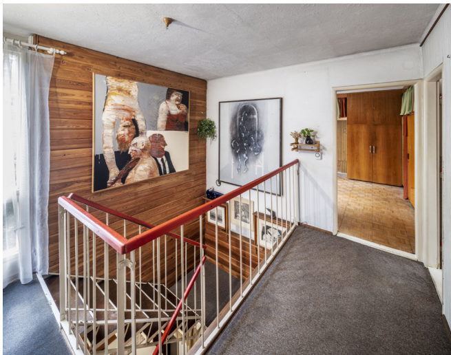
Obrázek 22 Schodiště a chodba Dům Karla Hubáčka