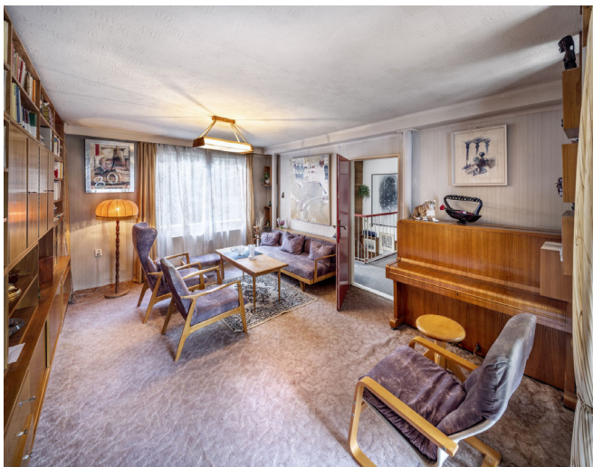
Obrázek 23 Obývací pokoj Dům Karla Hubáčka, zdroj: (Dům Karla Hubáčka, 2025)