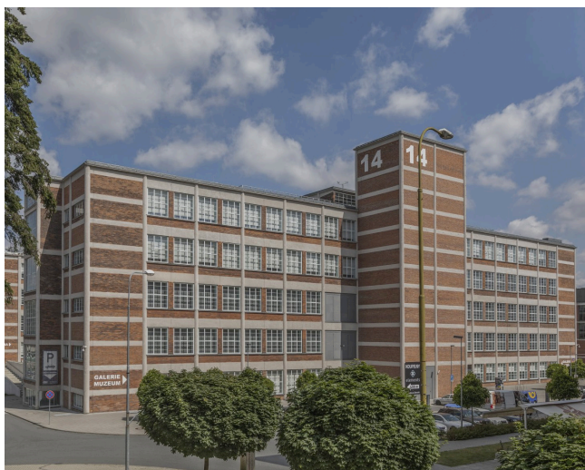
Obrázek 9 14/15 Baťův institut

Budovy 14 a 15 (Obrázek 9) představují pětietážové haly nového typu, které vyrostly na místě starších objektů, které byly poničeny při bombardování města v roce 1944 a následně strženy. Výstavba obou objektů probíhala mezi roky 1946 až 1949 a oproti starším typům hal se zlepšilo především vybavení, díky kterému bylo dosaženo lepších hygienických a pracovních podmínek. Výroba zde byla ukončena až v roce 1994. Budovu pak získal Zlínský kraj a v roce 2013 byla dokončena rekonstrukce podle Juraje Sonlajtnera, Jakuba Obůrky a A.D.N.S PRODUCTION. Nyní prostory slouží kulturním institucím Zlínského kraje (Budova 14 a 15, nedatováno).