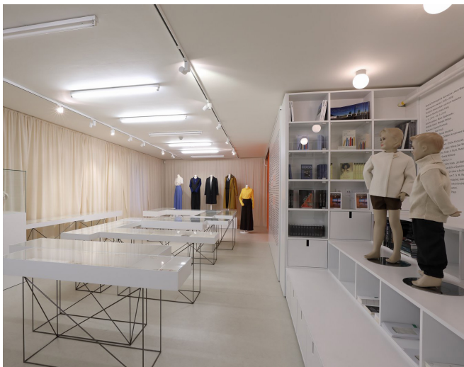
Obrázek 26 Interiér SDC Norbertov II