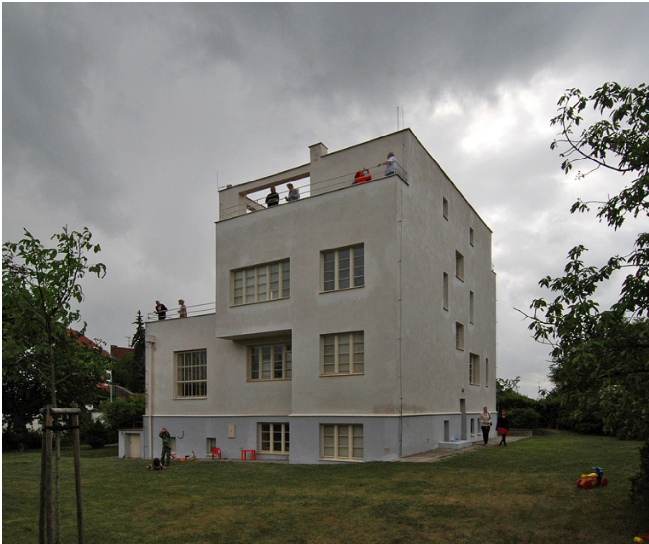
Obrázek 21 Vila Winternitz