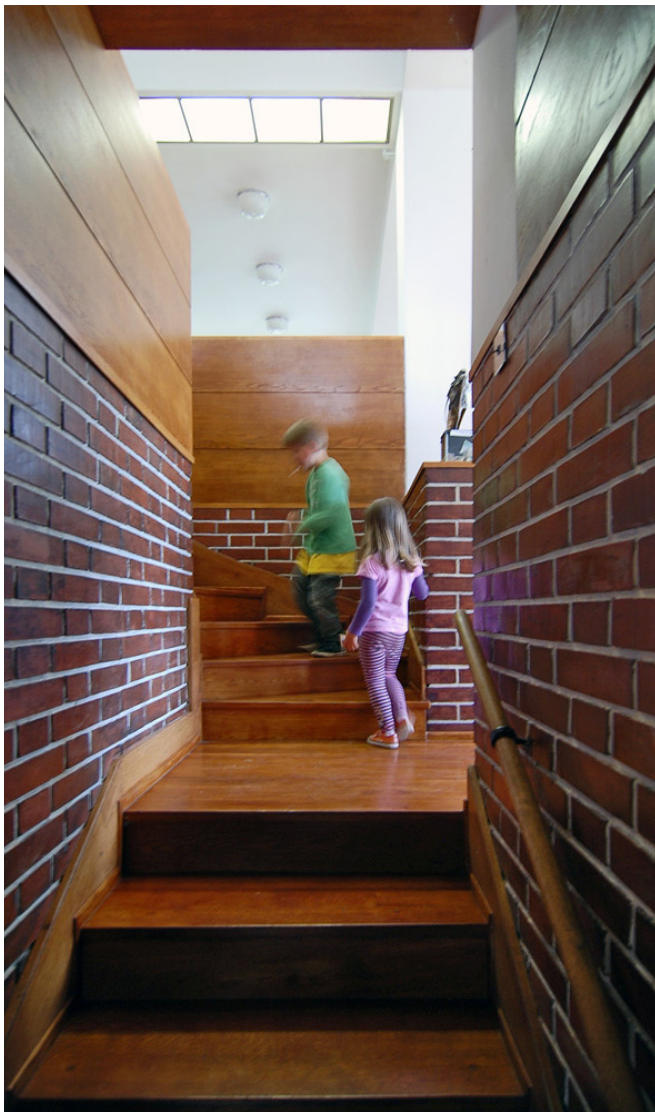
Obrázek 20 Interiér vily Winternitz, zdroj: (Winternitzova vila, nedatováno)