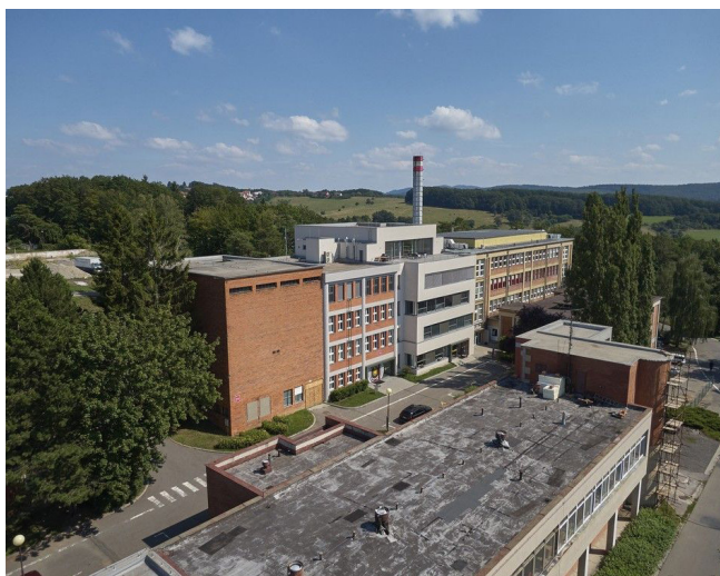
Obrázek 5 Areál zlínských filmových ateliérů, zdroj: (Filmové ateliéry, nedatováno)

Filmové ateliéry a laboratoře z let 1935 až 1936 (Obrázek 5) se nachází v Kudlově cca 2,5 km od Zlína. Autorem je Vladimír Karfík. Objekt se skládá se z administrativní části a přímo z ateliéru. Objekt byl poškozen požárem v roce 1944 i při osvobozování na konci druhé světové války o rok později. Původně malé ateliéry se následně rozrostly (Další dostavbu předstávají např. filmové laboratoře z let 1948 až 1951.) na komplex, kde dodnes probíhá filmová produkce (Filmový ateliér na Kudlově, nedatováno).