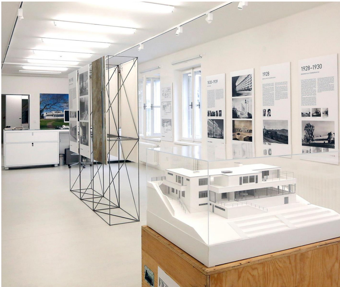
Obrázek 27 Interiér SDC Norbertov I