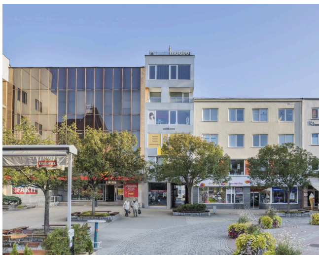
Obrázek 13 Polyfunkční dům „robot Emil“

Polyfunkční dům „robot Emil“ (Obrázek 13) zaplnil proluku po secesní budově hotelu Balkán na náměstí Míru. Autory jsou Svatopluk Sedláček a Karel Havliš a výstavba probíhala v letech 2003 až 2004. Dům stojí na parcele s poměrně netradičními rozměry 6,3 m na šířku a 60 m na délku, a přitom je součástí pasáž, která propojuje hlavní náměstí a ulici Zarámí. Konstrukčně jde o ocelový skelet založený na pilotách. Provozně se skládá z obchodní pasáže a kavárny v jedné části a kanceláří v části druhé. (Část kanceláří byla původně navržena jako velkometrážní byty s plochou 180 m 2 a 200 m 2 (Polyfunkční dům „Robot Emil“, nedatováno).