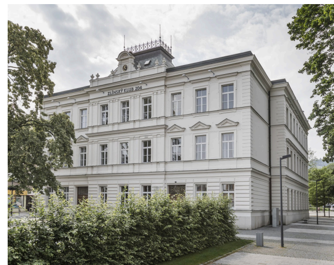
Obrázek 2 Měšťanská škola

Měšťanská škola (Obrázek 2) byla postavena podle návrhu architekta Dominika Feye z roku 1896. Jde o budovu v neoklasicistním stylu: dvoupatrový objekt se zastřešeným atriem. Po přestěhování školy v roce 1935 sloužila budova různým účelům. Dnes je využívána Klubem 204 jako místo setkávání neziskových organizací a centrum alternativní kultury. Od roku 2015 je součástí přístavba s kavárnou/restaurací (Měšťanská škola - Zlínský klub 204, nedatováno).