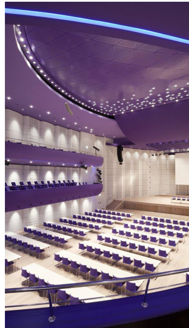
Obrázek 16 Kongresové a univerzitní centrum: interiér, zdroj: (Kongresové centrum Zlín, nedatováno)

Po-revoluční realizace ve Zlíně jsou tvořeny jak novostavbami „na zelené louce“, tak citlivými vstupy do existující zástavby v jádru města. Kromě kongresového a univerzitního centra navrhla ještě ve městě Eva Jiříčná např. budovu Fakulty humanitních studií UTB. Jedním tematických okruhů tak mohou být díla právě této architektky. Dostavby v historickém centru města představuje pak Polyfunkční dům „Emil“ nebo obchodní dům Zlaté jablko. Dále se ve městě nachází několik staveb, jejichž autorem je Jiří Gebrian (např. Prodejní centrum ABS nebo Městský dům Formule).