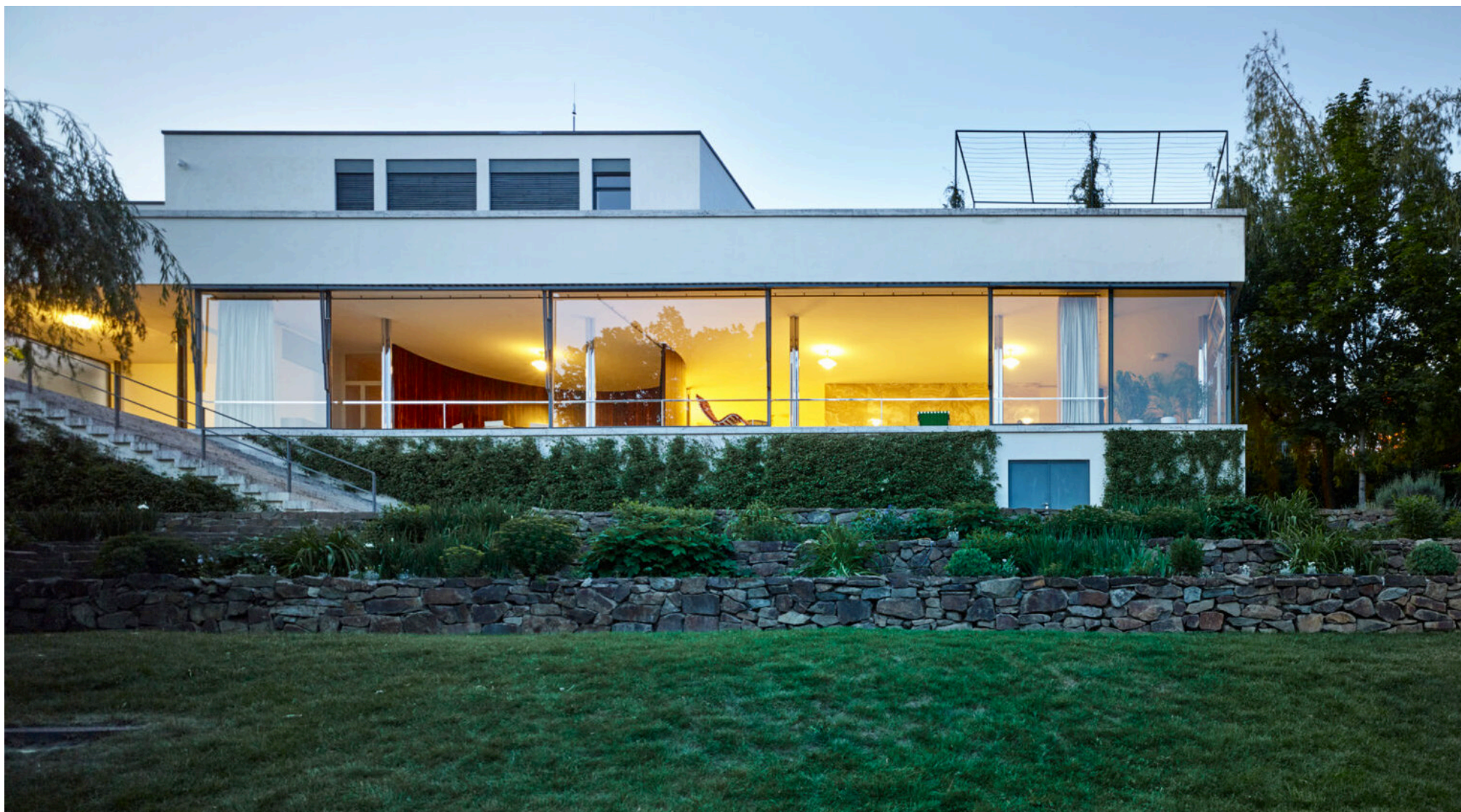
Obrázek 28 Vila Tugendhat, zdroj: (Fotogalerie vila Tugendhat, 2022)