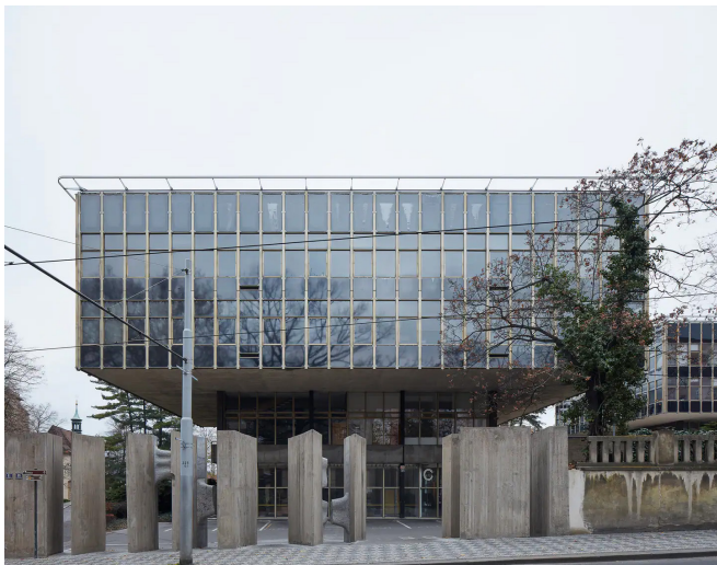
Obrázek 18 Pražský IPR