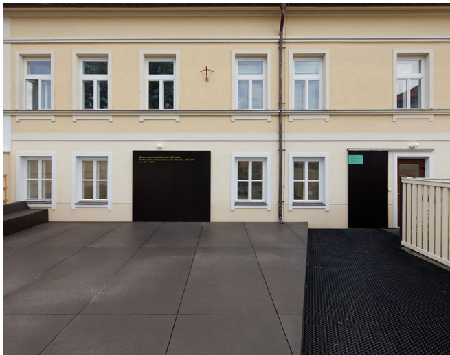
Obrázek 25 Exteriér SDC Norbertov