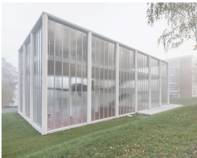
Obrázek 8 Památník Tomáše Bati zdroj: (Památník Tomáše Bati, nedatováno)

Památník Tomáše Bati (Obrázek 8) uzavírá Gahurův prospekt a byl dokončen v roce 1933. Jedná se o třípodlažní průhlednou halu. Je v ní demonstrována variabilita používaného konstrukčního systému, železobetonový skelet nemá žádnou vyzdívkou, v budově nejsou vůbec použity cihly. Památník byl poškozen bombardováním Zlína v roce 1944 a dále pak poválečnou přestavbou na Dům umění. Obnova proběhla v roce 2016 až 2019. Památník má dodatečné zázemí v sousedních Studijních ústavech (Památník Tomáše Bati, nedatováno).