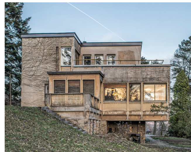
Obrázek 10 Zikmundova vila

Zikmundova vila (Obrázek 10) je původně z let 1933 až 1935 (František Lydie Gahura), byla ale přestavěna v roce 1953 (Zdeněk Plesník). Vila má proti ostatním baťovským objektům nezvyklé prvky jako např. pásové okno a bílou břízolitovou fasádu. Cenný je interiér, který se z velké části zachoval ve své autentické podobě. O vilu aktuálně pečuje nadační fond Zikmundova vila, který pořádá program pro veřejnost, komentované prohlídky a další aktivity (Zikmundova vila, nedatováno).