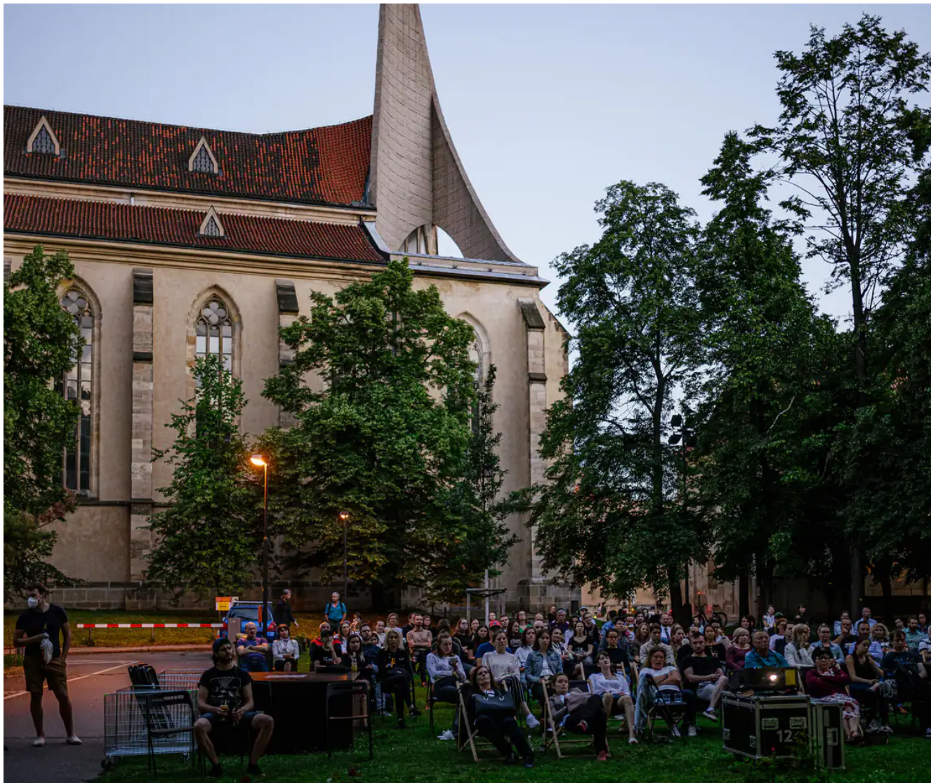
Obrázek 17 Promítání v zahradě u IPRu, zdroj: (CAMP - navštivte nás, nedatováno)