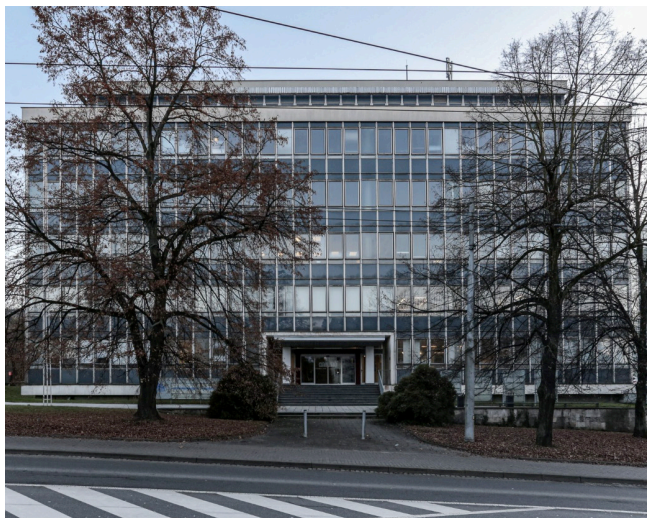
Obrázek 12 Centroprojekt, zdroj: (Centroprojekt, nedatováno)

Centroprojekt (Obrázek 12) byl sídlem stejnojmenné organizace, která navazovala na projekční a stavební činnost firmy Baťa (po jejím znárodnění). Architekty byl Zdeněk Plesník, Karel Krčmář, Oldřich Šlesinger a Ivan Příkryl a výstavba probíhala v letech 1965 až 1968. Nosná konstrukce se skládá z ocelových sloupů v modulech o rozměrech 6 x 6 m. Budova stále slouží transformované firmě Centroprojekt a dalším nájemcům (Centroprojekt, nedatováno).