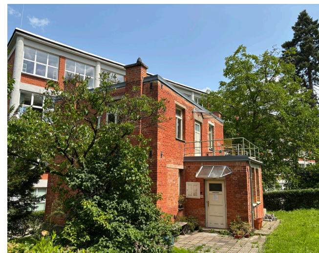
Obrázek 6 Infopoint bařovského bydlení

Bařovské domky jsou jedním z hlavních fenoménů města, jsou k nalezení ve čtvrtích Letná, Zálešná, Lesní čtvrť a další. Domů pro zaměstnance firmy Bařa bylo postaveno až 2000. Šlo o systematický a propracovaný proces výstavby, díky kterému bylo bydlení cenově dostupné, ale zároveň architektonicky a urbanisticky kvalitní. Domky se postupně vyvíjely a měly několik variant od čtyřdomku, dvojdomku a jednodomku až po individualizované vily, typicky pro management Bařovských závodů (např. vila Dominika Čipery nebo vila Františka Maloty). V jednom z bařovských domků sídlí Infopoint bařovského bydlení (Obrázek 6), který každý pátek nabízí komentované prohlídky, věnující se tématu bařovského bydlení (Bařovské bydlení I, nedatováno).