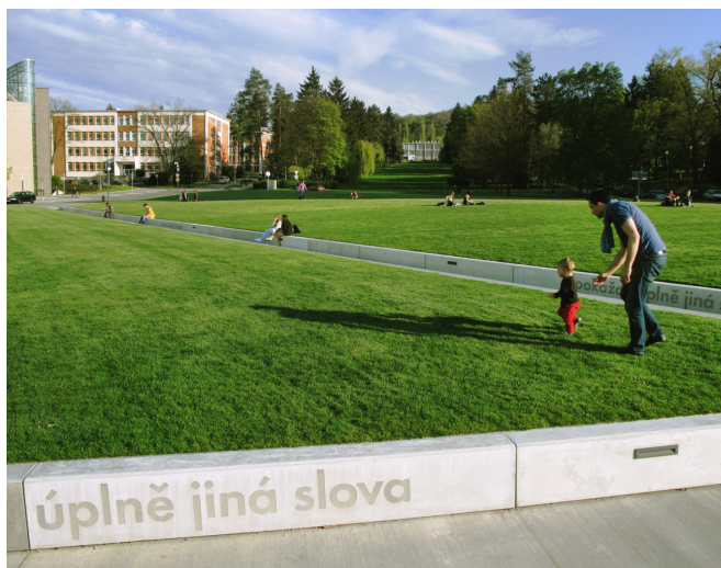
Obrázek 7 Gahurův prospekt, zdroj: (Revitalizace Gahurova prospektu, 2014)